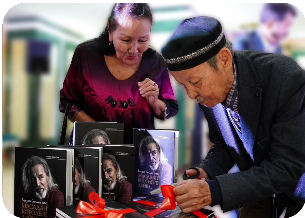
2 қараша «Бекзат болмыс иесі. МАСАДАН КОРОЛЬГЕ ДЕЙІН» зерттеу кітабының тұсаукесер рәсімі