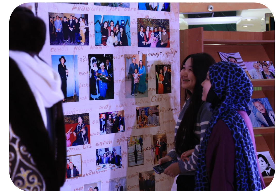
12 желтоқсан «Жібегімін Сағаттың» кітабының тұсаукесер рәсімі