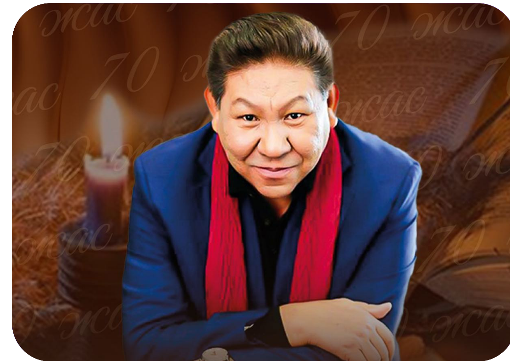
23 қараша Қазақстанның халық артисі, режиссер Талғат Теменовтің 70 жас мерейтойы